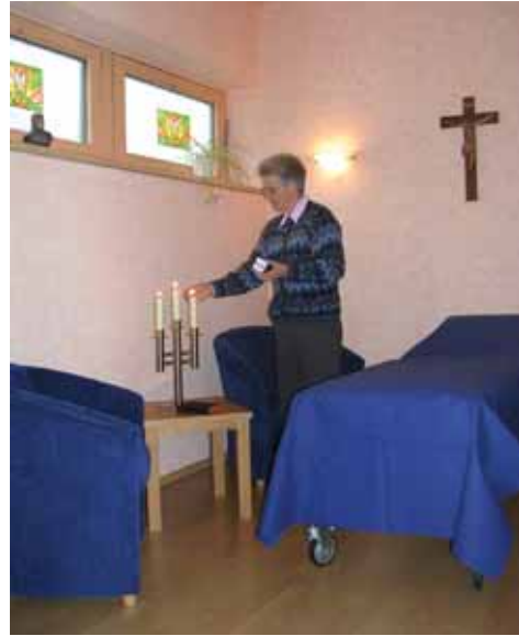
Ein Ort des Abschiednehmens im Wilhelm-Maxen-Haus, Garbsen

Was passiert dort? Ganz unterschiedliches. Es wird dort gebetet, die Angehörigen nehmen Abschied von Verstorbenen, erin-