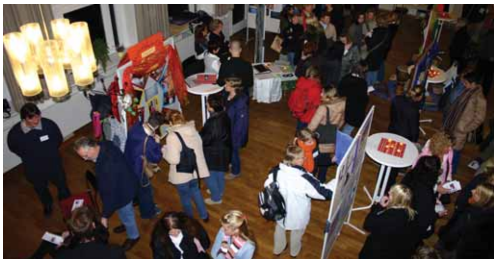
Projektmesse aus Anlass der Zwischenbilanz „Qualitätsoffensive Kindertagesstätten“