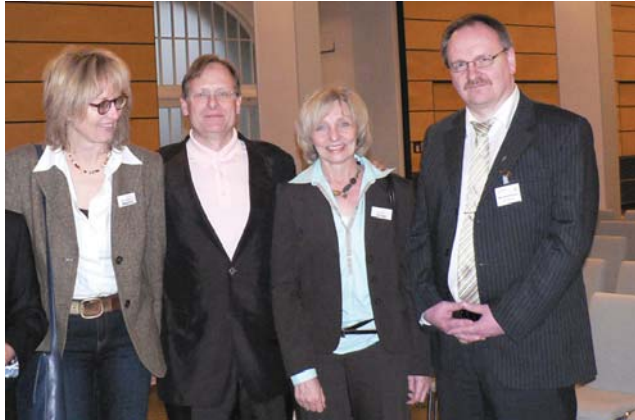
Geschäftsführung und Mitarbeiter der Caritas Krebsberatungsstelle danken Professor Grönemeyer für seinen ausgezeichneten Abschlussvortrag

Wenn der Name Grönemeyer fällt, denkt man schon lange nicht mehr nur an den Sänger, sondern auch an dessen Bruder,