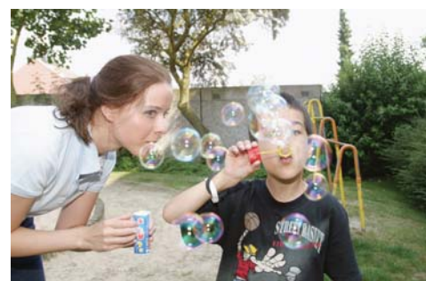
Nicht nur im Dschungelbuch hilft der große Balu seinem kleinen Freund Mogli

macht. Ob spielen, kochen, basteln, Natur erleben, Kino oder Museum besuchen, zusammen werden sie Neues entdecken und zu besprechen haben. Und ganz „nebenbei“ wird ihr „kleiner Freund“ mit viel Freude Lebenswichtiges lernen und