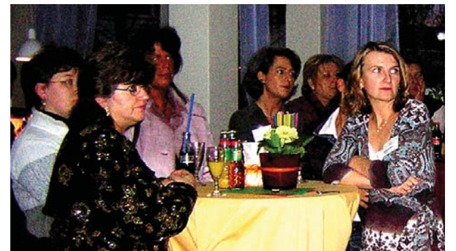
Interessierte Zuhörer bei der Eröffnung des ersten Familienzentrums der Caritas Hannover.

Die Kindertageseinrichtungen zeichnen sich durch Nähe aus – sie sind nah im jeweiligen Quartier; sie sind nah an den Familien; sie sind nah an den Kindern. Die Kindertageseinrichtung gehört einfach zur Lebenswelt junger Familien. Daher erscheint es der Caritas Hannover mehr als sinnvoll, diese Einrichtungen noch intensiver zu nutzen, indem dort zukünftig mehr denn je bedarfsgerechte und passgenaue Angebote der Elternbildung und -beratung sowie Angebote sozialer Hilfen gebündelt und vernetzt werden. So sollen alle Kinder-